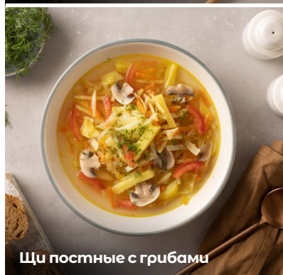
Щи постные с грибами