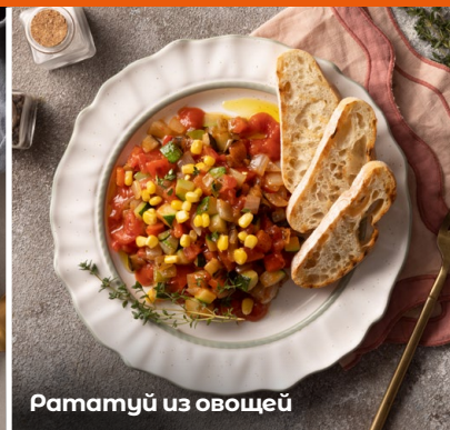
Рататуй из овощей