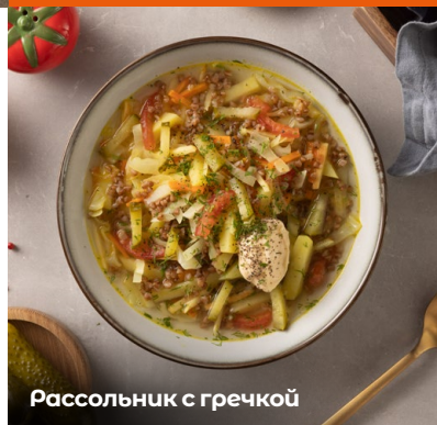
Рассольник с гречкой